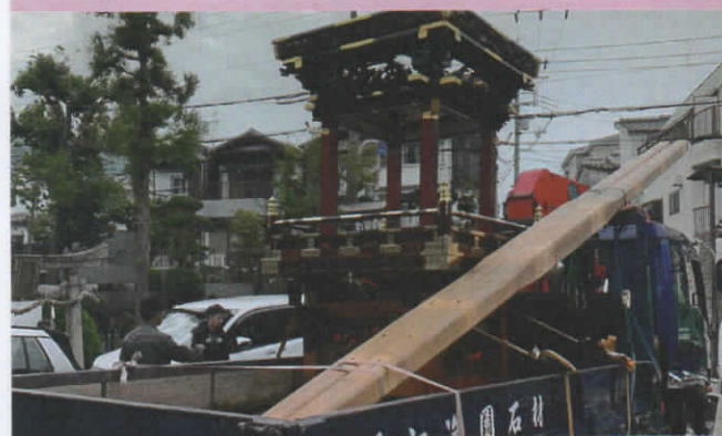
有志の手で解体された旧太鼓台は、貴重な彫物等を部品取りし新しい太鼓台へ引き継がれるため、丹波神社を出発し淡路島の梶内だんじり店へ搬入されました。