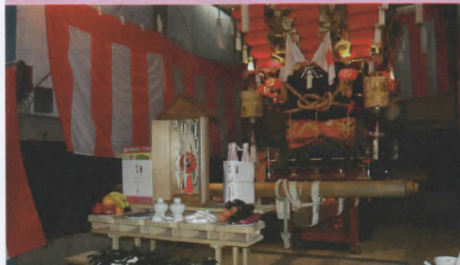
2019年10月20日 日下太鼓台 昇魂式 祭壇