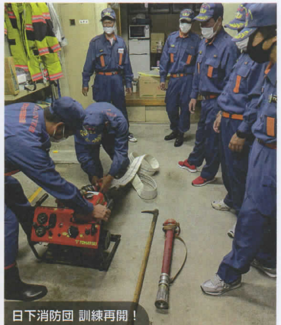
日下消防団 訓練再開！

今後も新型コロナウイルスの影響を見ながらはなりますが、役員一同一丸となり、地域の宝である子供たちの健全な育成につなげる子ども会活動を行ってまいりますので、今後子ども会活動にご理解、ご協力をお願いいたします。